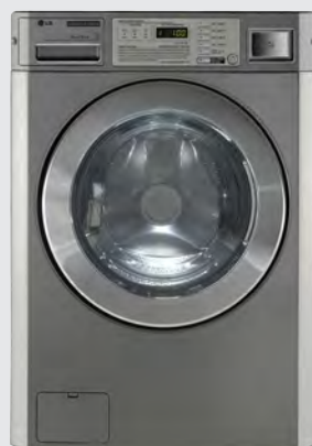
FH069DFDS à superposer avec séchoir équipé d'un monnayeur double. Emplacement pour tiroir à pièces.