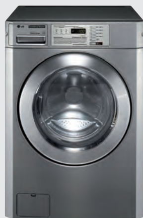
FH069FD2FS Tiroir à lessive en façade. Superposable avec séchoir GIANT